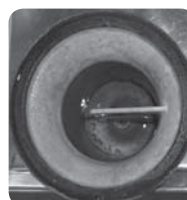
Ny vandlås efter 2 mdr.